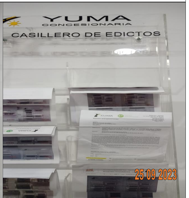
EDICTO P_03112 YC-CRT-130657